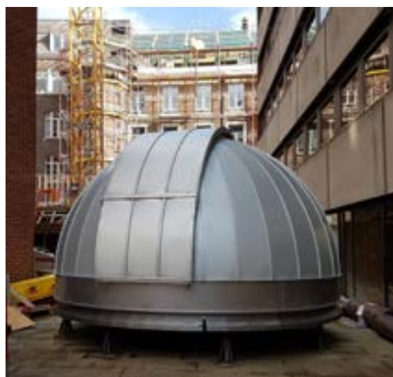
La coupole astronomique automatisée de 4,42 m de diamètre, 3 m de haut et pesant une tonne a été assemblée à Namur début octobre.