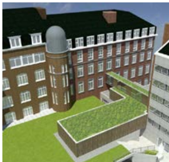
L'observatoire dans son environnement, à côté du bâtiment de biologie et à l'arrière de la Faculté de médecine, Place du Palais de Justice.

Il s'agit du projet de toute une communauté : la communauté universitaire, la communauté des alumni, la communauté des Namurois qui se sont manifestés afin d'encourager cette initiative et de la soutenir financièrement, dans le cadre d'une opération de crowdfunding. Les fonds récoltés permettront d'équiper la coupole et d'acquérir des équipements de pointe adaptés à la pollution lumineuse et à l'observation du soleil en toute sécurité.