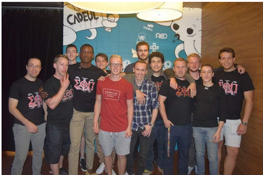
Fraternité à Laval