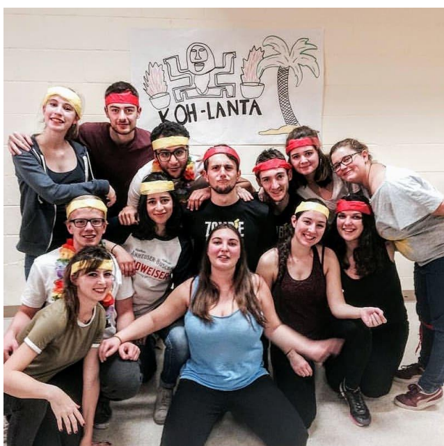
Amis à Laval