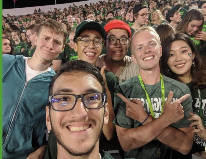
Amis à MSU