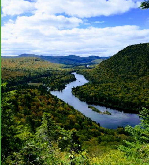
Parc Jacques Cartier à Québec